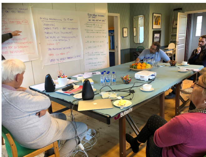
Bild: Från ett utforskande samtal anordnat av Samarbetsdynamik i Degerfors 2019.

Samarbetsdynamiks samtal har genom åren erbjudit en fristående arena där de egna resonemangen kunnat nötas och blötas så att var och en på ”hemmaplan” i sitt respektive arbete (eller annat socialt sammanhang) kunnat bidra på ett lite mer precist sätt i de samtal som förs där. Denna arena har blivit möjlig tack vare att tillräckligt många andra engagerade och erfarna praktiker från helt olika fält varit villiga att lägga tid och kraft i att gemensamt hjälpas åt att precisera ett resonemang eller att utforska något delvis okänt.